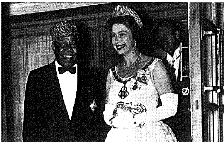
President Abboud besöker Storbritannien 1964. Samma år störtas han.