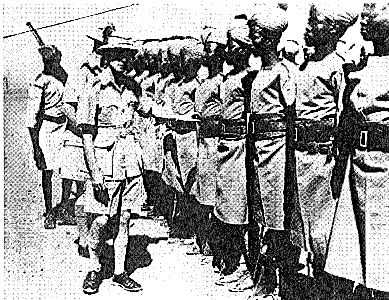
Sudanesiska soldater under brittisk befäl 1940

1898 Slaget vid Omdurman då britterna återupprättar sultanatet. Britterna slår ner mahdistupproret. Lord Kitchener befälhavare. Churchill är med (och skriver om det). Britterna ockuperar Egypten 1882-1922/1952. (NE)