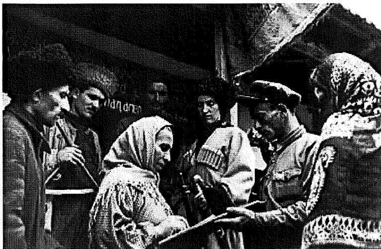
En bild från en kolchos, ett kollektivjordbruk i den dåvarande republiken Tjetjeno-Ingusjien 1938.

1936 dec Stalin låter bilda en autonom republik Tjetjenska ASSR. ( Amina.com+Enc Britannica )