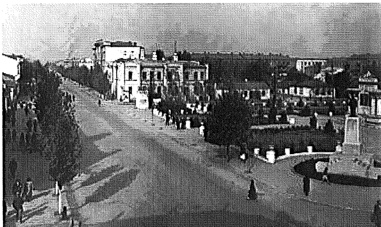
Grozny 1938

apr Ramzan Kadyrov svärs in som premiärminister som ett led i "tjetjeniseringen" dvs att Moskva låter en lokal moskvatrogen tjetjensk elit sköta jobbet. Allt enl: ( Enc Britannica Yearbook 2008 )